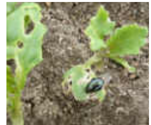
Lochfraß durch adulten Rapserrdfloh

Exirel® enthält 100 g/l Cyantraniliprole (als Suspoemulsion), einen Wirkstoff aus der Gruppe der Diamide, deren Wirkungsmechanismus in die Gruppe 28 der IRAC (Insecticide Resistance Action Committee) – Klassifizierung eingestuft ist. Cyantraniliprole aktiviert Ryanodin-Rezeptoren von Insekten; dies bewirkt eine Entleerung der intrazellulären Kalziumvorräte. Als Folge treten Muskellähmung und letztendlich der Tod der Insekten ein. Cyantraniliprole wirkt hauptsächlich über orale Aufnahme (Lecken/Fraß), aber auch über Kontakt gegen verschiedene Entwicklungsstadien von Insekten.