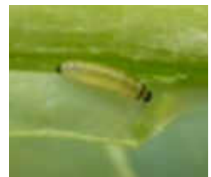
Larven des Rapserrdflohs

Die Anwendung von Exirel® gegen den Rapserrdfloh erfolgt nach Warndienstaufwurf bzw. nach Erreichen von Schwellenwerten, ab Keimblätter voll entfaltet bis neuntes Laubblatt entfaltet (BBCH 10–19), mit einer Aufwandmenge von 0,4 l/ha in mindestens 200 l Wasser/ha. Käfer werden überwiegend über Fraß kontrolliert. Die Wirkungsweise auf Larven ist gegeben, wenn sie vor dem Minieren der Stängel und Blattstiele bekämpft werden. Der Einsatz von Exirel® kann auch auf Flächen erfolgen, auf denen mit einer Cyantraniliprole-haltigen Beize behandelter Raps gesät wurde.