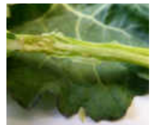
Schaden durch Larven des Rapserrdflohs

Der Schaden am Raps wird durch Adulte und Larven verursacht. Die Käfer wandern in die Rapsbestände ein und verursachen Lochfraß an den Blättern. Bei starkem Befall kann es bis zum Totalausfall kommen. Etwa Mitte September erfolgt die Eiablage. Die noch im Herbst schlüpfenden Larven bohren sich in die Stängel und Blattstiele ein und gelangen von dort in das Innere der Pflanze. Anschließend kann es zu einem Befall mit Pilzkrankheiten und einer verringerten Winterhärte kommen. Die Pflanzen können auswintern. Sie vergilben und sterben ab.