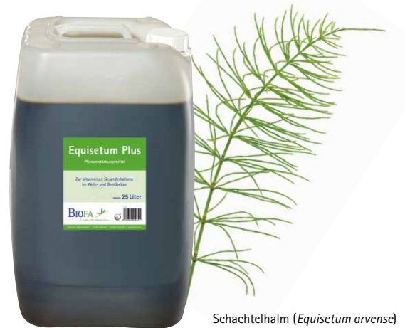
Schachtelhalm ( Equisetum arvense )

Aufgrund seines hohen Siliziumgehaltes fördert Equisetum Plus die Ernährung und Kräftigung der Pflanze. Natürliche Kieselsäure wird verstärkt in die Zellwände eingelagert (Verkieselung) . Dies festigt Zellwände und Epidermis und stärkt somit die Pflanzen gegenüber abiotischem Stress und schwächebedingtem Pilzbefall.