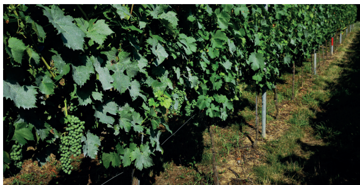
Nach der Applikation von SulfoLiq® 800 SC

*FL = Freiland, GH = Gewächshaus / **WZ = Wartezeit, F = Wartezeit ist durch die Vegetationszeit abgedeckt, N = Wartezeit ohne Bedeutung / ***NE = Aus eigener Erfahrung gute Nebenwirkung